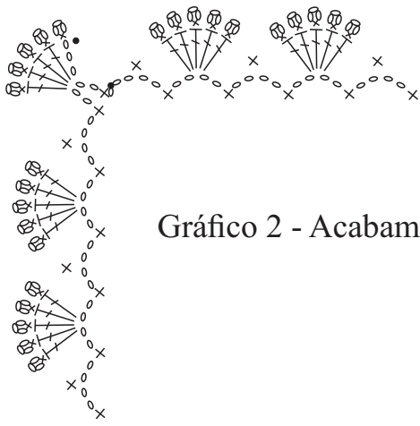
Gráfico 2 - Acabamento