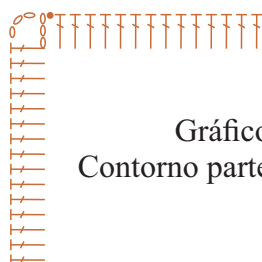
Gráfico 2 Contorno parte da frente

Inicie com 80 correntinhas + 3 correntinhas para virar o trabalho