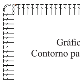
Gráfico 4 Contorno parte de trás