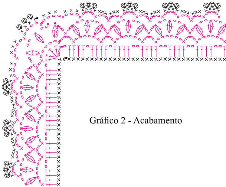
Gráfico 2 - Acabamento

Iniciar com 80 corr. + 3 corr. para virar o trabalho